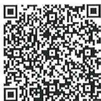
สแกนสมัครอบรม