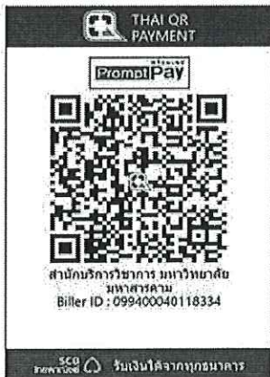
สแกน QR Code เพื่อชำระค่าลงทะเบียน.