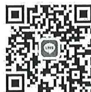
สแกนส่งหลักฐานการชำระค่าลงทะเบียนและสอบถามข้อมูลเพิ่มเติม